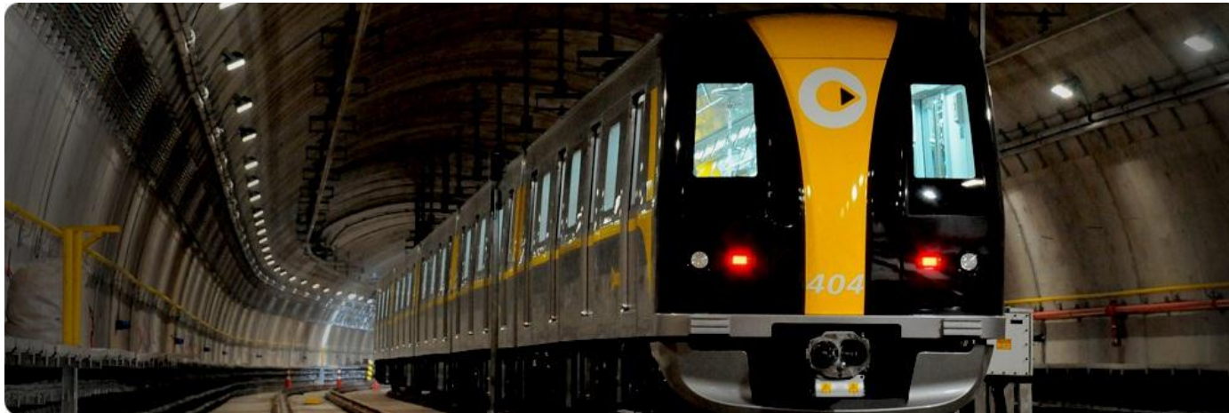
Línea 4 del Metro de São Paulo: Consortio ViaQuatro